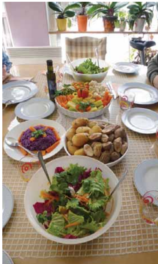
Sveži presni sokovi in organska hrana priskrbijo telesu gorivo za krepitev imunskega sistema.

Vsako jutro bolnikom zmerijo krvni tlak, temperaturo telesa in telesno