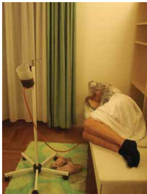
Bolniki med klistiranjem ležejo na desni bok v položaj zarodka.

Hipokratovo juho, pripravljeno na majhnem ognju iz zelene, čebule, paradiznika, pora, česna, krompirja, peteršiljevega korena in malo listov peteršilja, je treba zaužiti dvakrat dnevno, spodbuja namreč delovanje ledvic. V začetku sta na dan dovoljeni dve jedilni žlici lanenega olja, bogatega z omega-3 maščobnimi kislinami, nato pa do konca te-